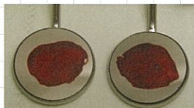
〈1時間乾燥後、洗浄前〉