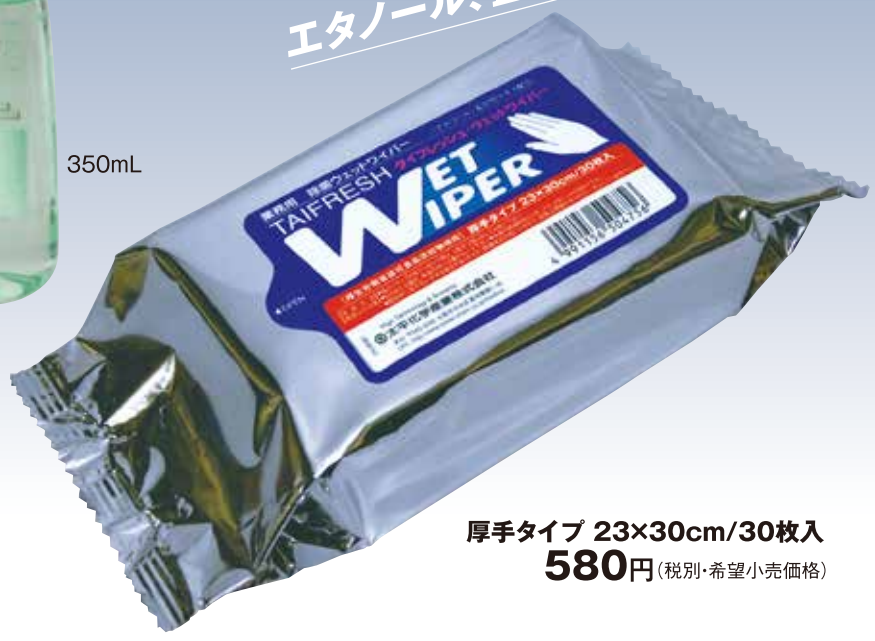
厚手タイプ 23x30cm/30枚入 580円(税別・希望小売価格)